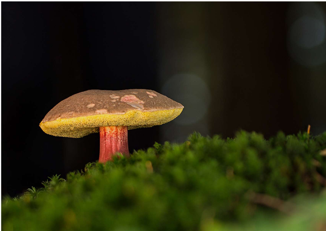
Rotfussröhrling