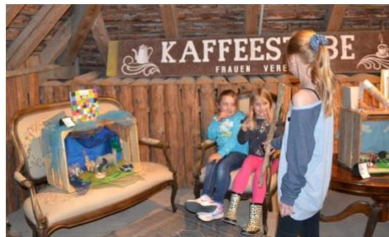
Book in a box im Dachboden der alten Chesi