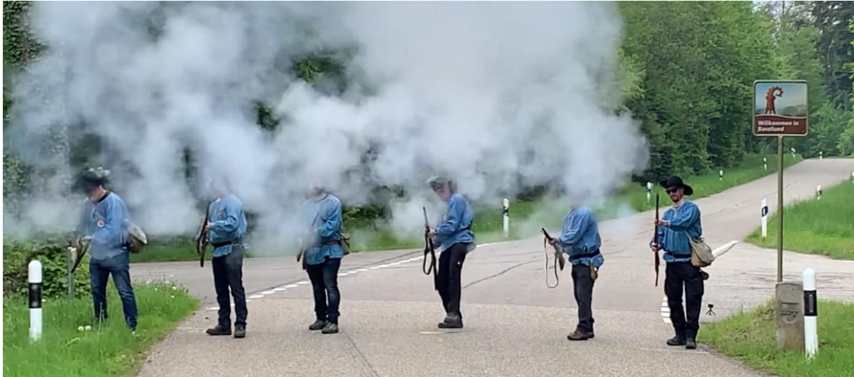
Bester Grenzschutz auf der Grenze zu Wittnau durch die Banntagsschützen

Auch der nicht wegzudenkende Kletterbaum wurde von den Kindern und Jugendlichen rasch in Besitz genommen und mit viel Kletterelan Stück für Stück der Süssigkeiten entledigt. Des Weiteren animierte der traditionelle Wettbewerb einen Grossteil der Anwesenden zum Mitmachen. Dabei gingen die Preise für einmal nicht nur an die Ortsansässigen, sondern auch an Auswärts.