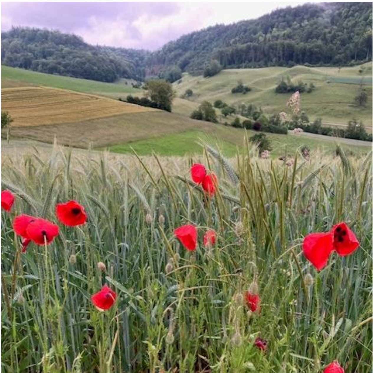
Blick vom Ramstel gegen Bad