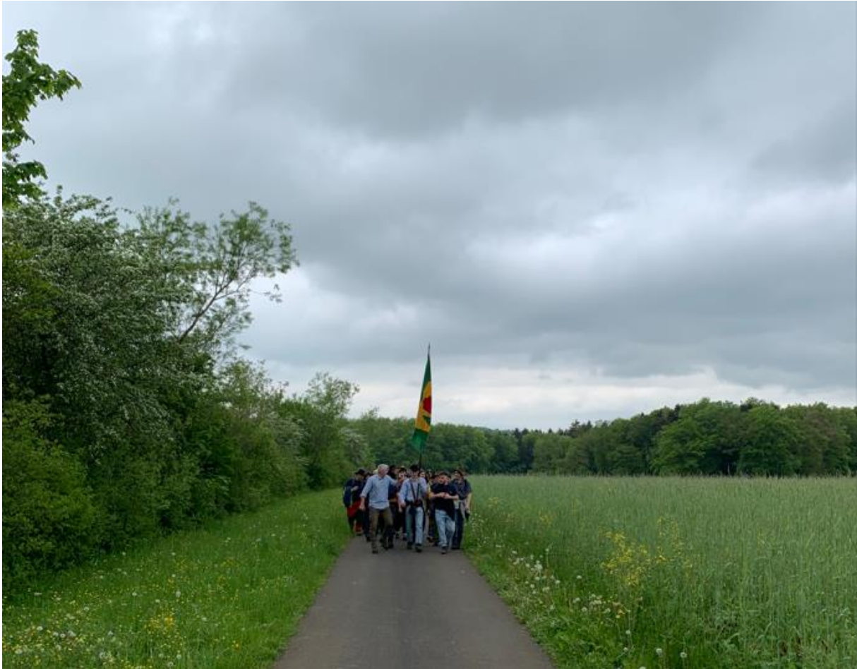
Rotte entlang Anwiler Grenze im Gebiet Stöckacher

Schon wieder fünf Wochen ist es her, wo sich Rothenflüherinnen, Rothenflüher, Heimweh-Rothenflüher*innen und Gäste zum traditionellen Banntag versammelten und um 10.00 Uhr mit Ziel Waldhütte im Dorf abmarschierten. Die rege Teilnahme bestätigt das Bedürfnis und die Wichtigkeit dieses zu wählenden Anlasses.