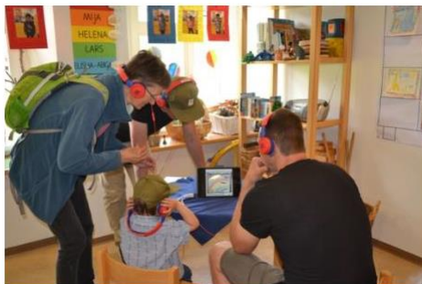
Sprechende Briefmarken im Kindergarten