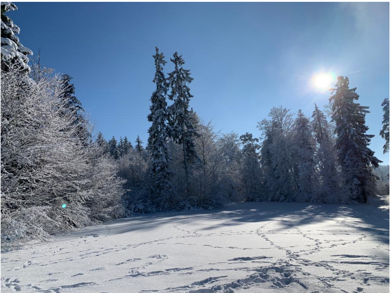
Auf dem Limpberg im Dezember 2023